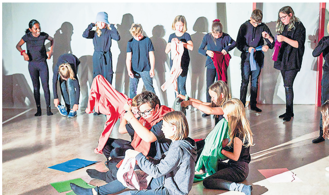
Im Jahr 2019 fand bereits ein theaterpädagogisches Projekt statt, jedoch noch in viel kleineren Dimensionen, es waren nämlich lediglich Schulklassen des Schulhauses Nordstrasse involviert.

Theaterpädagogisches Projekt zum 100-Jahr-Jubiläum des Welttheaters Einsiedeln 2024 startet bald