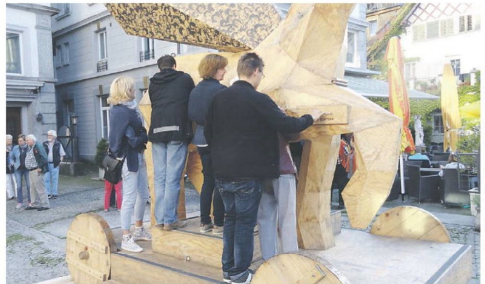
Neugierig beobachten die Menschen, was sich hinter den Gucklöchern befindet.

Über eine Kamera im Knie des Pferds kann man sich selbst in das Innere des Pferds projizieren lassen und auch die Inszenierung des Einsiedler Welttheaters von Thomas Hürlimann und Volker Hesse ist zu entdecken.